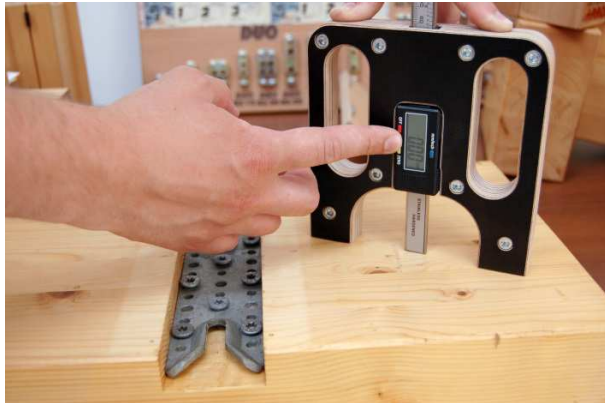
Tiefenlehre auf „0“ stellen

Zum Kontrollieren der Einfrästiefe und Höhe der Halteschraube