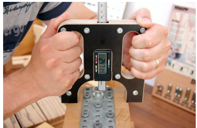
Nach dem Einbauen der aufgeschraubten Verbindertafel–Kragenbolzenhöhe kontrollieren ( \pm 0,5 mm)