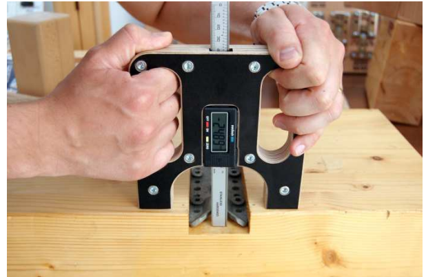
Tiefe der Ausfräsung kontrollieren ( \pm 0,5 mm)